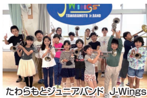
たわらもどジュニアバンド、J-Wings