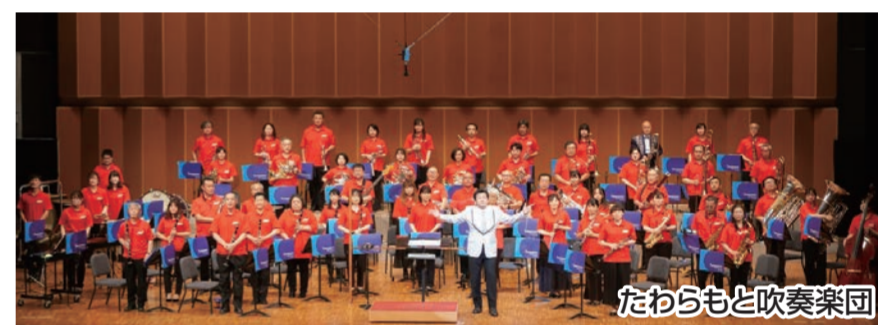
たわらもど吹奏楽団