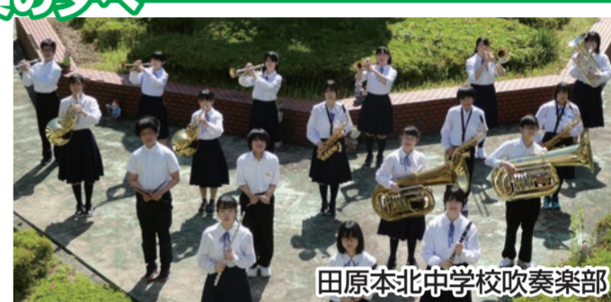
田原本北中学校吹奏楽部