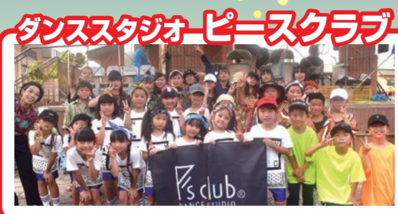
ダンススタジオピースクラブ