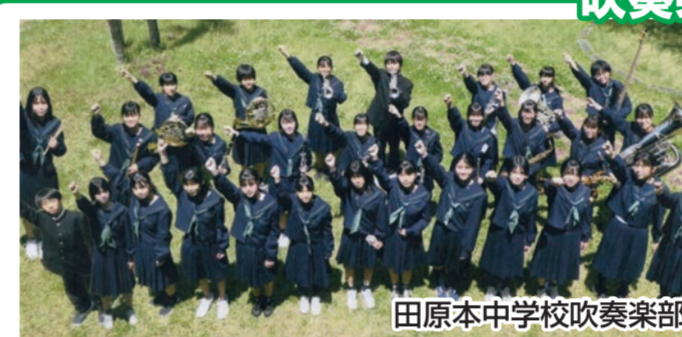
田原本中学校吹奏楽部