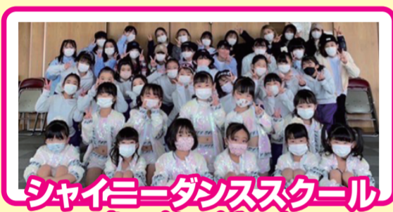
シャイニーダンススクール (ヒップホップダンス)