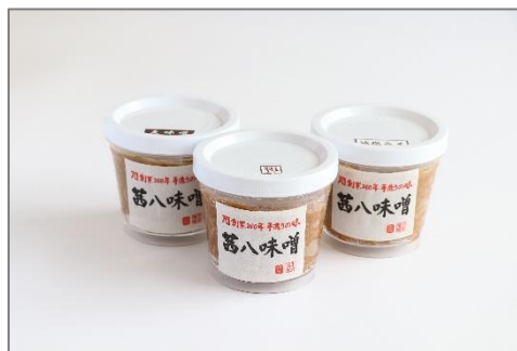
嶋田味噌「お試し3種セット」

「お試し3種(麦・麴〈粗〉・減塩)セット」や、手前味噌セット2kgを、お試し用や小家族向けに当ショップのオリジナルで販売します。