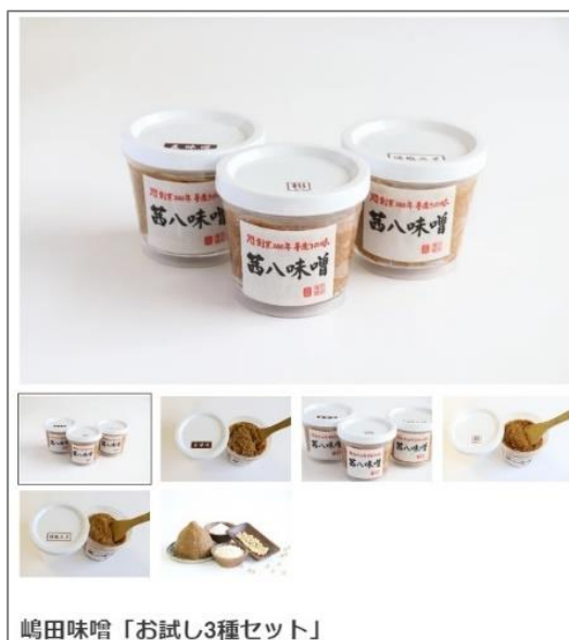
サイトイメージ (左：トップページ 右：商品ページの一部)